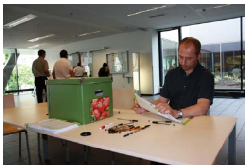
Konsument der Betriebsküche in Linz füllt den Fragebogen aus