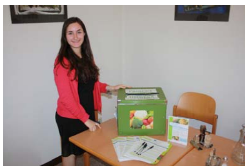
Interviewerin mit der Sammelbox für ausgefüllte Fragebögen